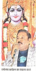
रामोत्सव कार्यक्रम का संरक्षण करने शरद्वेग्य सिंह • जगद्वारा