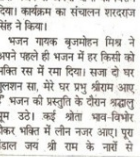
रमन जी गुला