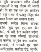
डॉ. दीपक जैन