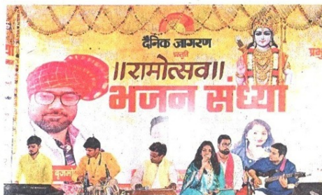
नया परिवार रियासत सभागार में दैनिक जागरण द्वारा आयोजित रामोत्सव भजन संध्या में भजन प्रस्तुत करते भजन गायक